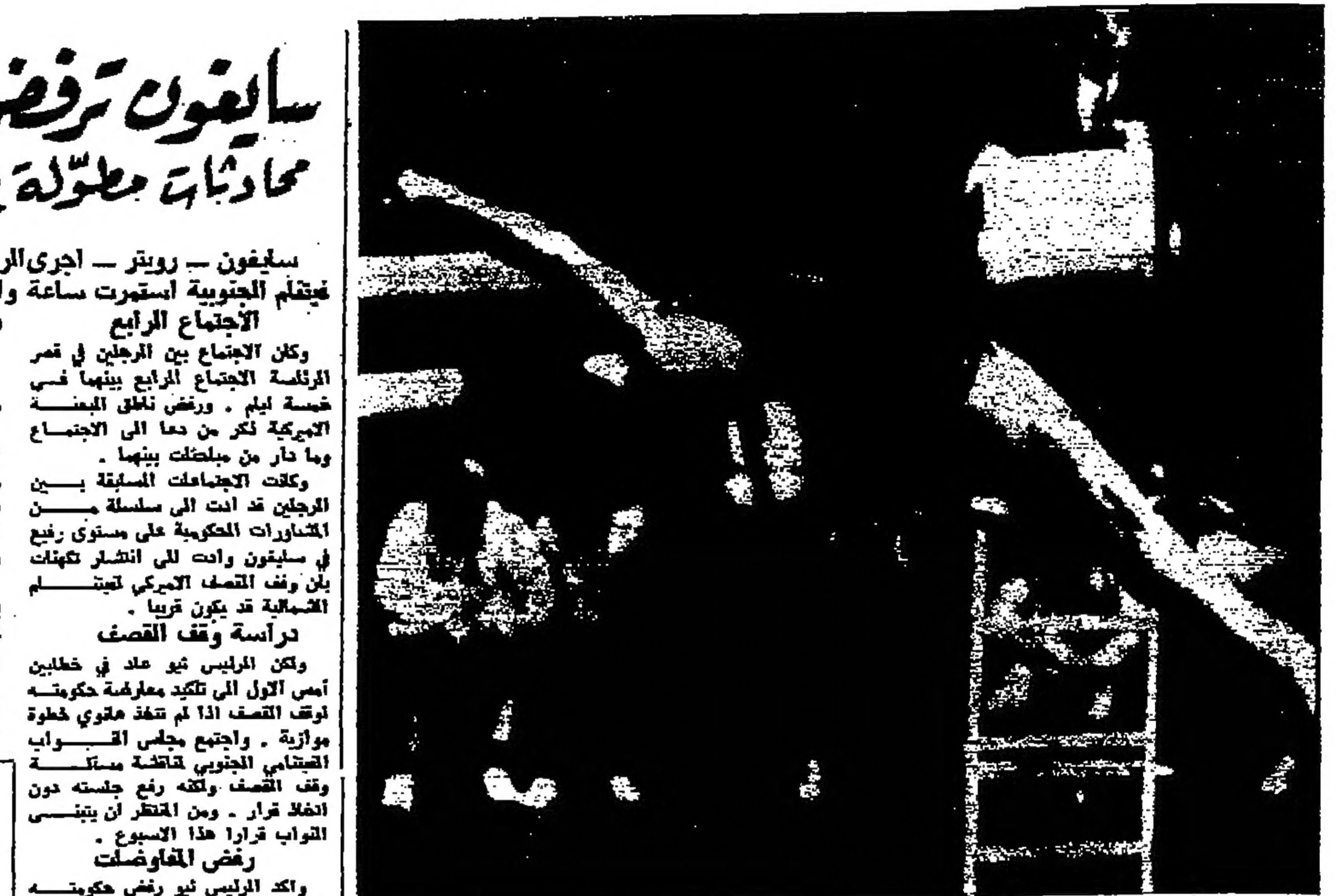
السباحة الأمريكية بيكي كينغ تتسوق بقميص عاكسة خلال الألعاب الأولمبية وهي على وشك ان تسير في سباق العزل القضي الذي يبلغ طوله ثلاثة امتار. وقد نبح فيما بعد انها كبرت لراها (صورة لاسكية)

وزارة الاشغال العامة بحاجة الى متعدد بشأن تقديم وتوزيع ٣١٠٠٠ حصة فولية و ٣١٠٠٠ حصة حصيدية لشروع داميا - الشونة الشمالية كم ٢٢ - نفلى من بود الاشتراك مراجعة رئيس قسم المعاملات والمشتريات لاستلام الشروط والمواصفات - آخر موعد لقبول العروض الساعة العاشرة من صباح يوم الاثنين الموافق ١٩٦٨-١١-١١ رئيس لجنة المعاملات المركزية للاشتغال العامة المهندس سعيد بينسو